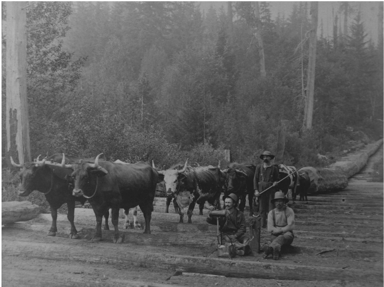
Bêtes de trait