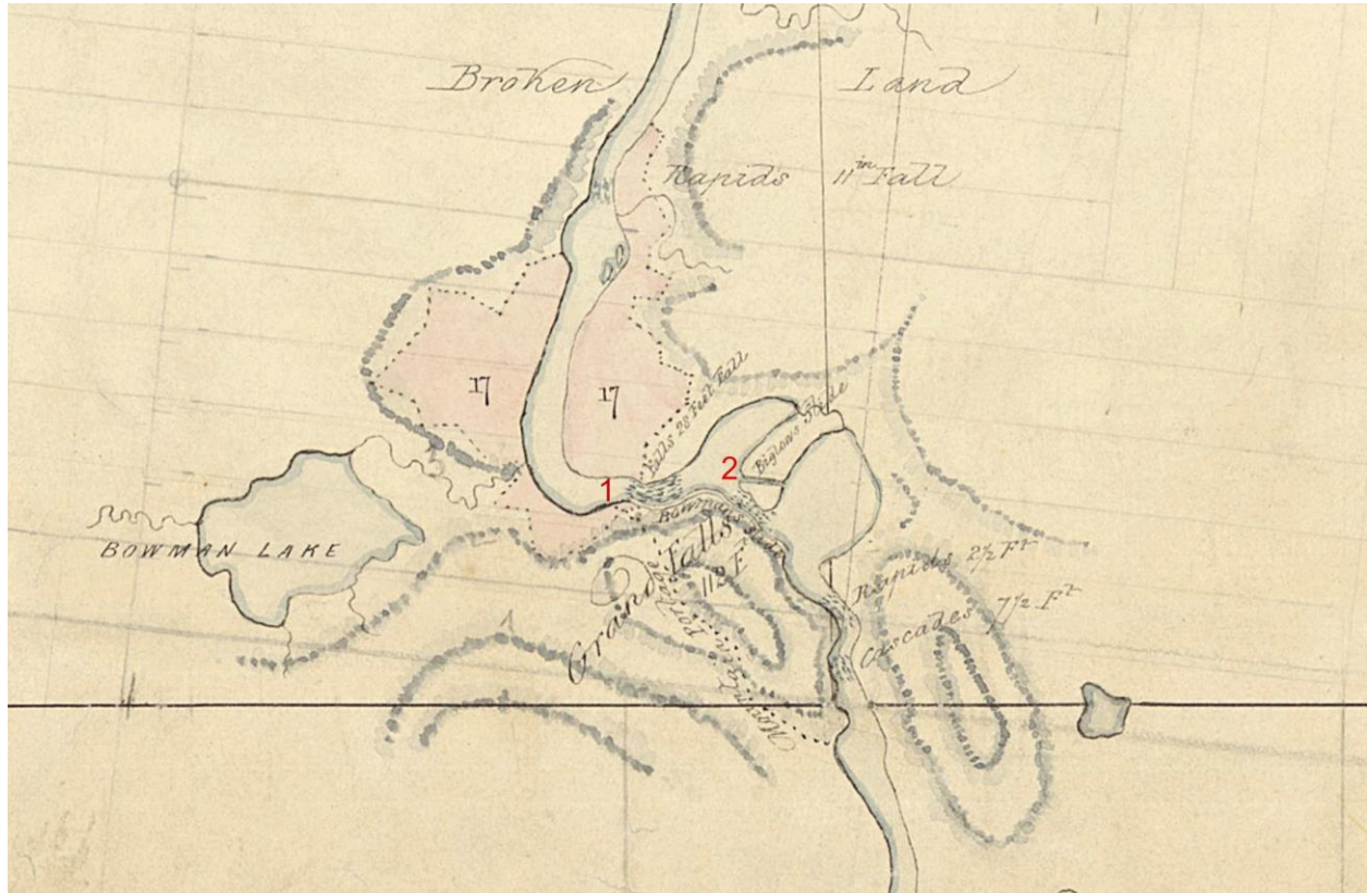
extrait d'une carte montrant l'emplacement des glissoires de Baxter Bowman 1 et de Levi Bigelow 2 au High Falls sur la rivière du Lièvre.

En 1833, Bowman va être le premier à construire une glissoire à billes aux chutes de High Falls pour permettre aux billes de bois, flottant sur la rivière, de descendre sans être endommagées par les chutes pour continuer leurs voyages vers Buckingham.